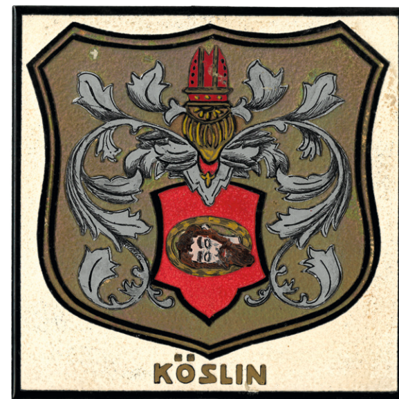
Wappenkachel als Wandschmuck in der Kösliner und Köslin-Bublitzer Ferienwohnung in Travemünde

Wir wünschen Ihnen angenehme Tage und gute Erholung und hoffen, daß Sie gerne an diese Zeit zurückdenken und nochmal wiederkommen.