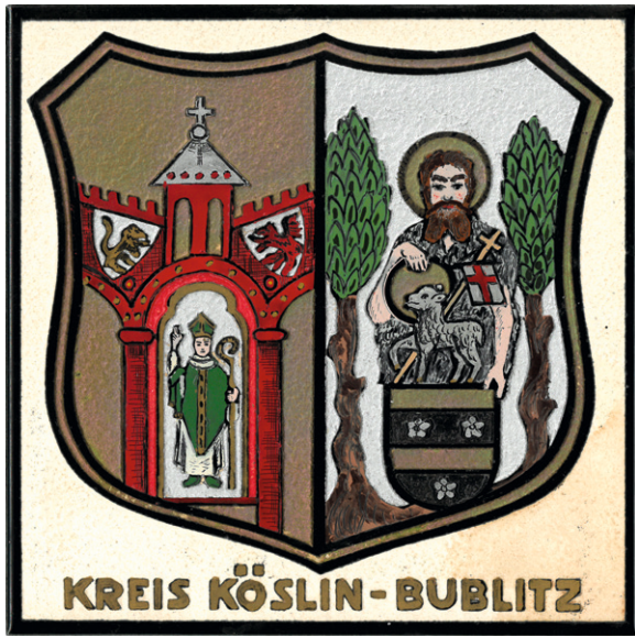
Wappenkachel als Wandschmuck in der Kösliner und Köslin-Bublitzer Ferienwohnung in Travemünde